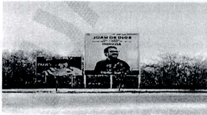
Boulevard Francisco Labastida Ochoa (malecón nuevo) y paseo Tamazula.