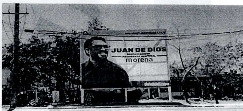
Carretera Los Mochis- Culiacán frente al monumento a Cuauhtémoc en la glorieta del mismo nombre del lado poniente.

43. Para demostrar la veracidad de sus afirmaciones el partido actor aporta como pruebas cuatro impresiones fotográficas, las cuales se insertan a continuación: