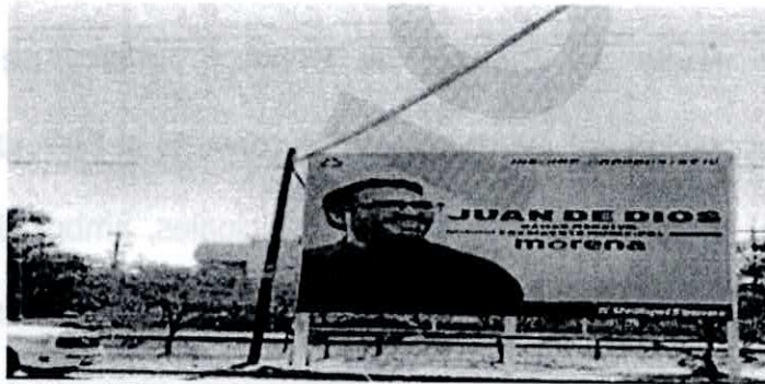
Boulevard Miguel Tamayo Espinoza de los Monteros, frente a la rectoría de la Universidad Autónoma, entrada a fraccionamiento Valle Alto.